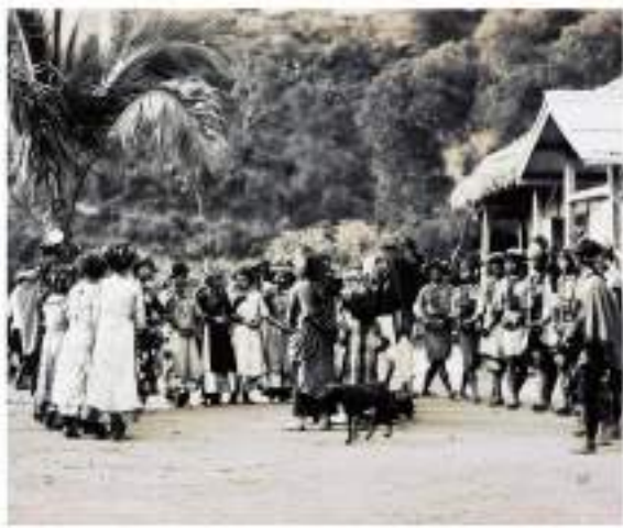
Figure 15: A group of people gathered outdoors, possibly a community meeting or a group of workers.

Figure 14: A group of people gathered outdoors, possibly a community meeting or a group of workers.