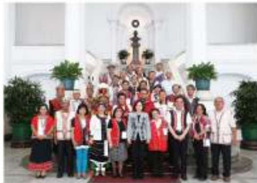
Universiti Kebangsaan Malaysia